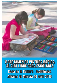
V CERTAMEN DE PINTURA RÁPIDA AL AIRE LIBRE PARA ESCOLARES Casa de la Cultura - 9:30 horas Alhama de Murcia, 10 abril 2010