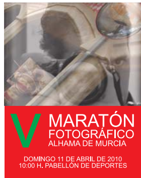
MARATÓN FOTOGRÁFICO ALHAMA DE MURCIA DOMINGO 11 DE ABRIL DE 2010 10:00 H. PABELLÓN DE DEPORTES

CERTAMEN NACIONAL DE PINTURA RÁPIDA AL AIRE LIBRE